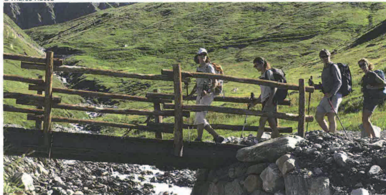
Sopra, il Lago Blu (Breuil-Cervinia) adagiato in una conca morenica, è lo specchio naturale del Cervino. Accanto, escursionismo verso il Col Malatra.