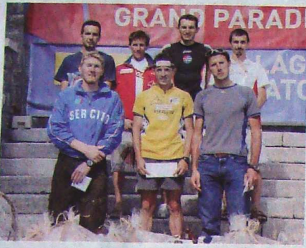
Il podio maschile e a destra quello femminile della competizione disputata nel cuore del Parco del Gran Paradiso, «sulle tracce» dei minatori